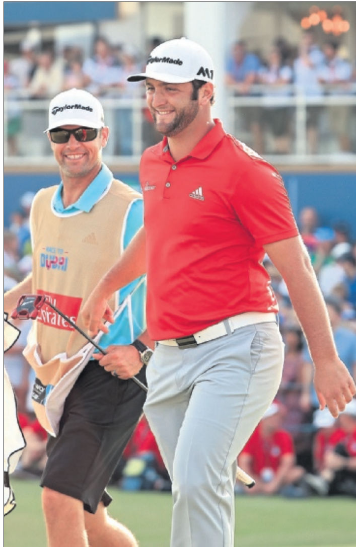
TRIUNFADOR. Rahm, en Dubai. Antes se formó en Arizona State.

Jon Rahm confirmó el domingo en Dubai que es la nueva sensación del golf. El número cuatro del mundo acabó en junio del año pasado Comunicación en Arizona State. Allí se formó gracias a una beca otorgada por su buen nivel con los palos. Es el camino que emprenden ahora muchos jóvenes deportistas españoles.